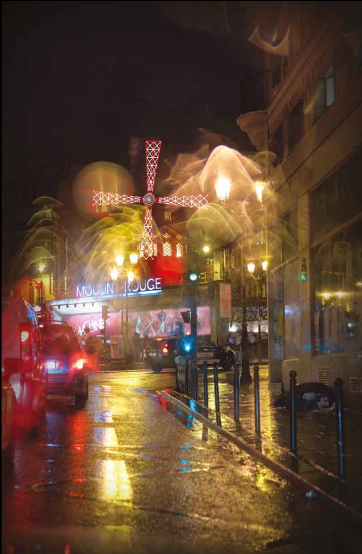
Le Moulin Rouge