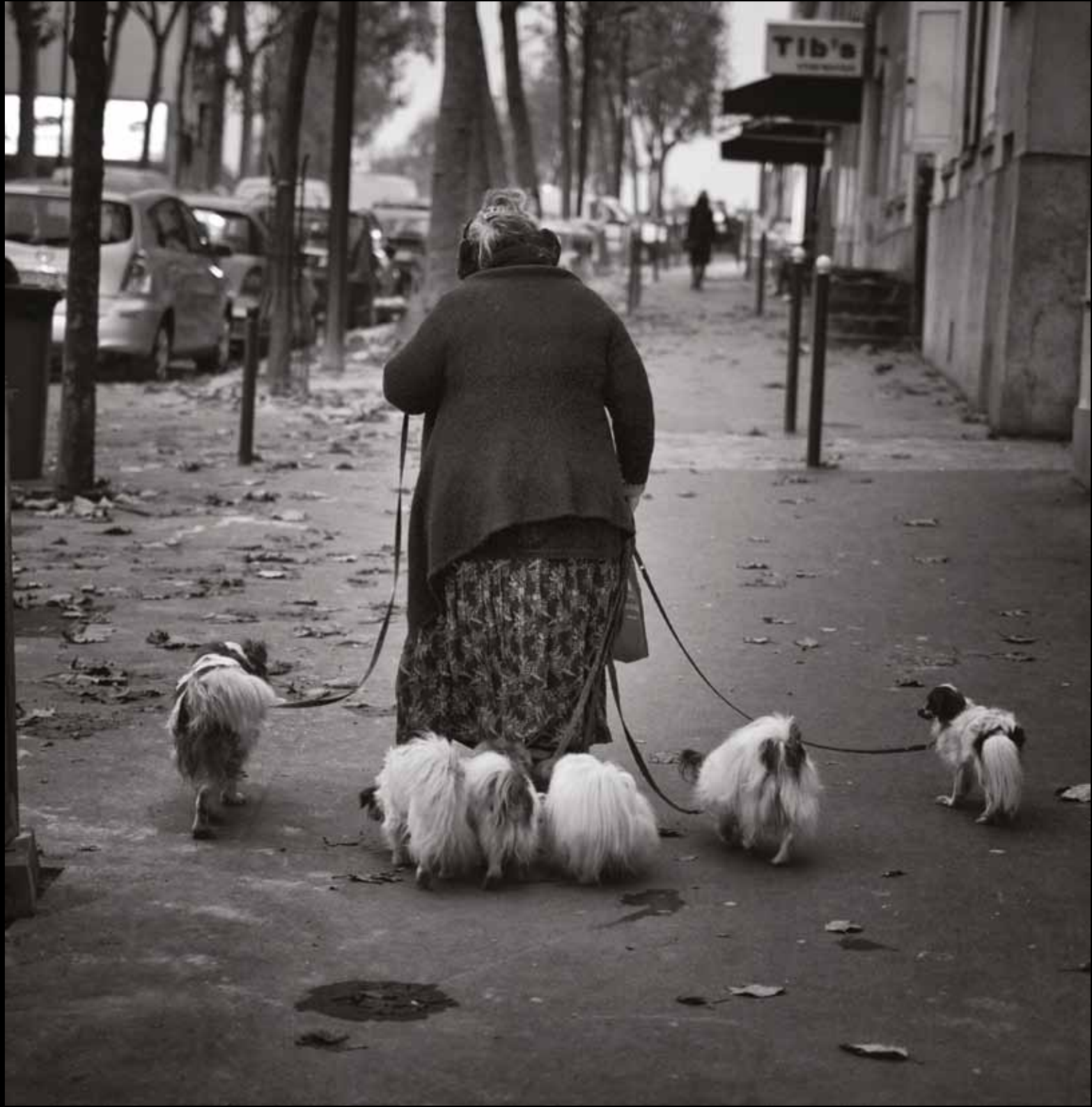
La dame aux cabots / Woman with dogs